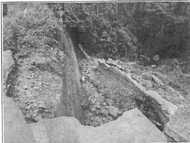
工區 1 衛星定位點：X 座標 217669 Y 座標 2573564 (TWD-97)