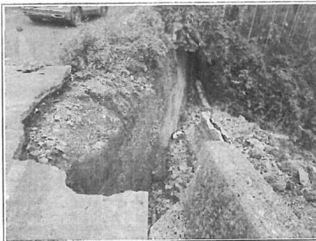
工區 1 衛星定位點：X 座標 217669 Y 座標 2573564 (TWD-97)