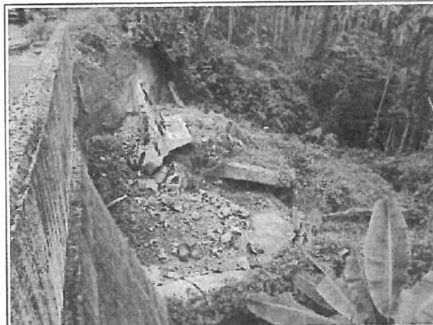
工區 1 衛星定位點：X 座標 217669 Y 座標 2573564 (TWD-97)